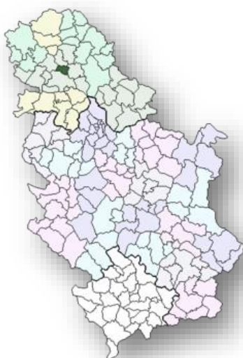
Слика 2: Општина Темерин

Општина Темерин улаже посебне напоре да на свом подручју створи повољан амбијент за привлачење инвестиција и подстицање економског развоја. У том смислу Општина је ставила акценат на развој комуналне инфраструктуре и формулисање посебних подстицајних мера економског развоја.