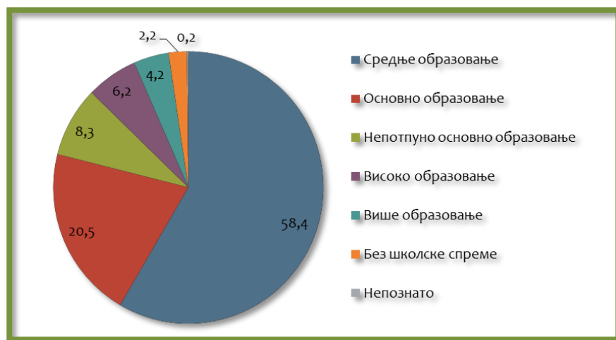
Графикон 2: Образовна структура становништва старијег од 15 година на нивоу општине Темерин, 2011. Година