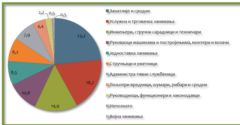
Графикон 3: Занимања на нивоу општине Темерин, 2011. година